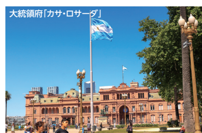
大統領府「カサ・ロサダ」

アール・デコやアール・ヌーヴォーの建築スタイルの街並みがヨーロッパの雰囲気を持つブエノスアイレス。大統領府「カサ・ロサダ」がある5月広場や世界三大劇場に挙げられるコロソ劇場、そしてボカ地区のカミニートの散策などにご案内します。