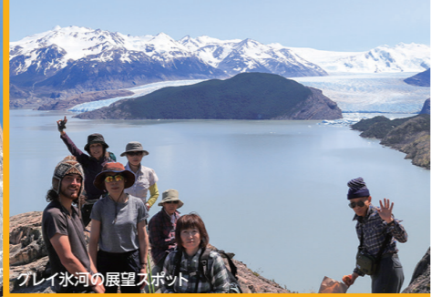
グレイ氷河の展望スポット

Torres del Paine Los Glaciares Tierra del Fuego