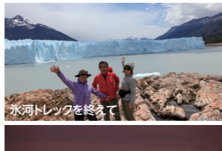
氷河トレックを終えて