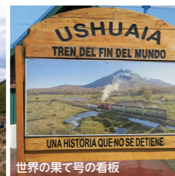
世界の果ての看板