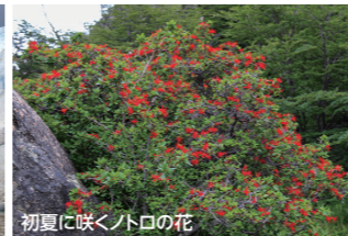
初夏に咲くノトコの花