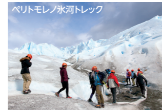
ペリトモレノ氷河トレック