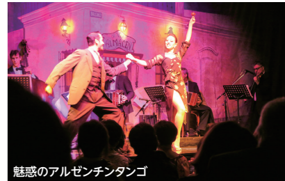
魅惑のアルゼンチンタンゴ

ブエノスアイレスの港町ボカ地区で生まれたと言われるアルゼンチンタンゴ。旅情を誘う音楽と魅惑的な衣装や照明、そしてもちろんタンゴの華麗なステップと足さばきで観客を魅了します。ブエノスアイレスの夜はタンゲリアアのひと時をお楽しみください。