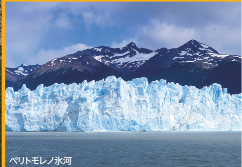
ペリトモレノ氷河