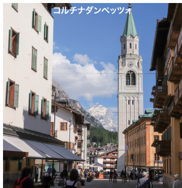
コルチナダンペッツォ