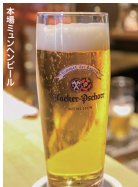
本場ミュンヘンビール