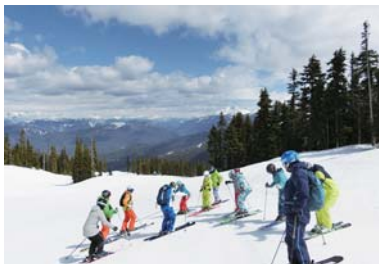
ワンポイントレッスン

毎年恒例のカナディアンロッキー初滑りツアー。北米エリアでは最も早いツアーとなっています。世界自然遺産の大自然に囲まれ、内陸特有の上質なシャンパンスノーは初滑りに最適です。午前中はゲレンデをクルージングしながらワンポイントレッスンをを行い、午後はその日のテーマにそってレッスン後、2班に分かれてフリースキーも楽しめます。午前中にはビデオ撮影も行い、ランチの時間にチェックし午後の滑走に活かします。バンフの街から2つのスキー場へはバスを利用しますが、次々と移り変わる車窓からの景色は絶景です。