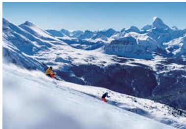
サンシャインビレッジ

車で約25分、カナダの名峰アシニボインを望む上質な雪質が好評のスキー場です。どのエリアも斜度変化に富んだおり練習には最適です。11月上旬より殆ど天然雪のみでオープンしているため、日本では決して体験できないシーズンインとなるでしょう。エキスパート向けのオフピステエリアも充実しています。