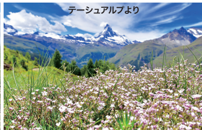
テッシュアルプより