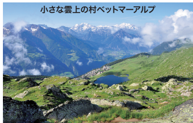
小さな雲上の村ベットマーアルプ