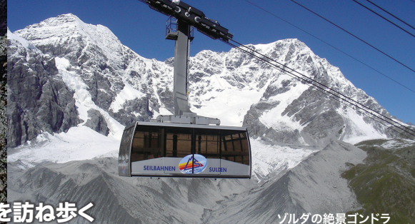
ゾルダの絶景ゴンドラ

イタリアのロンバルディア州、トレンティーノ・アルト・アディジェ州そして周辺のオーストリア、スイス国境に近く聳える4000m級のオルトレス山塊と南チロルの山岳風景が広がります。かつてはオーストリア領であった南チロル地方は、戦後イタリアに帰属されましたが同じイタリアながら、オルトレス山塊の南側ではドイツ語圏の文化、歴史が色濃く残っています。オルトレス(3905m)を筆頭にグラン・ゼブル(3859m)、モンテ・チェヴェダレ(3769m)など氷河を頂く高山の景観を、各方面に造形された渓谷からアプローチしながらこの地域だけでしか出会えない風景を迫ります。ロンバルディア州ボルミオ方面のファルヴァ渓谷、フォルニ渓谷からは南・西側からのオルトレス山塊の絶景。トレンティーノ・アルト・アディジェ州ゾルダ方面のゾルダ渓谷からは最も美しい正真正銘の北斜面からのオルトレス山塊の大パノラマを堪能します。また、冬には雪で閉ざされてしまうオルトレス、ステルヴィオ山塊をイタリアからスイス、オーストリアへと結ぶウンブライル峠(2503m)、ステルヴィオ峠(2757m)など風向明媚な峠からの絶景ハイキングコースを歩けるのも感動ものです。イタリアのヴェノスタ渓谷からは、オーストリア国境に聳えるエッツターラーアルペン、シュナールス渓谷の氷河を纏った3000m級のチロルのピークを眺めることができます。最後は東側から迫るマルテッコ渓谷へ広大なステルヴィオ国立公園の縦走ハイキングをして旅を締めくくります。他のヨーロッパアルプスのそれとは一味違った氷河、稜線、草原、湖水そして地元の暮らしに迫る風景をじっくりとご体験いただけます。