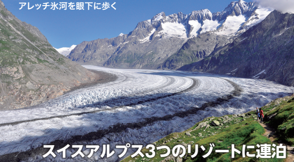
アレッチ氷河を眼下に歩く

既存のパッケージツアーや個人旅行でもなかなか歩く機会の少ないコースを厳選して企画しました。簡単にはたどり着けない断崖にそびえるグレックシュタイン小屋やアレッチ氷河を眼下に望むエッグスホルンへのピークハントなどを組み込み歩きこたえのある絶景コースをご案内します。ベットマーアルプの可愛らしい村での滞りもお楽しみください。