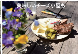
美味しいチーズ小屋も