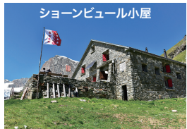
ションビュール小屋