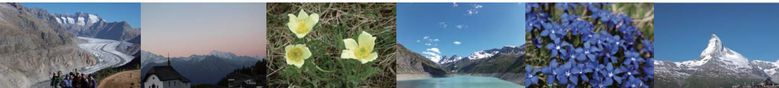
スネガからのマッターホルン