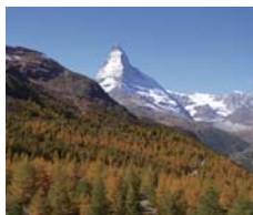
秋のツェルマット

夏にはアルペンローゼやエンツィアン（リンドウ）をはじめとした高山植物の花々を眺めてのハイキングが楽しめます。秋にはより一層澄んだ空気の中、山々の稜線が際立ち、山麓のカラマツは黄金色に染まる季節です。夏、秋ともにそれぞれにスイスの美しい自然に触れていただけのコースです。