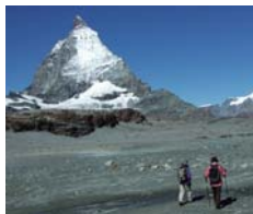
マッターホルン東壁に迫る

マッターホルン山麓、人気のツェルマットでは団体ツアーが訪れることの少ないこだわりのハイキングコースにご案内します。トロッケナーシュテックから迫力のマッターホルン東壁に迫るトレイルとテーシュアルプからマッターホルンとツェルマットの町を望むトレイルを歩きます。